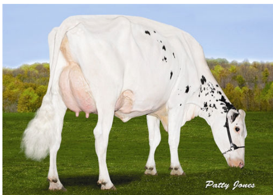
VELTHUIS SG SNOW EVENT FOURTH DAM