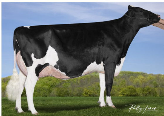
SILVERRIDGE V DUKE EMAIL DAM