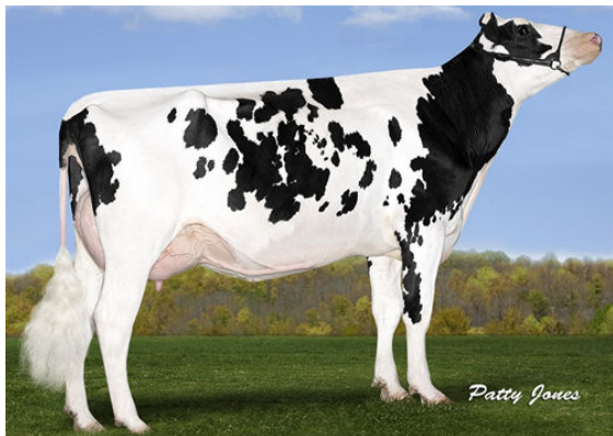
SILVERRIDGE V MUNITION EARWIG THIRD DAM